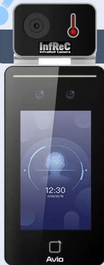
タブレット型 サーモグラフィカメラ InfReC T15A-FS