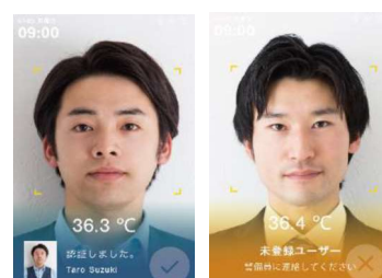
顔認証を利用してユーザ管理が可能

3000人のデータを登録して顔認証でき、未登録者を 検出します。 顔認証機能を使用して入退室 管理を行うと、出退勤履歴 とあわせてスクリーニング 判定結果を記録できます。