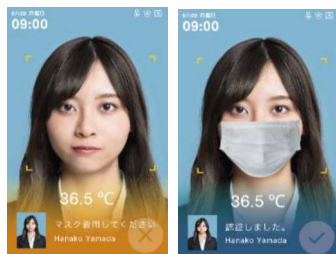
モードの選択でマスク未着用も判定

顔位置を検出して人工知能 が瞬時に体温を推定して 表示・判定します。 また、マスク未着用時に アラートを出すモードも 選択できます。